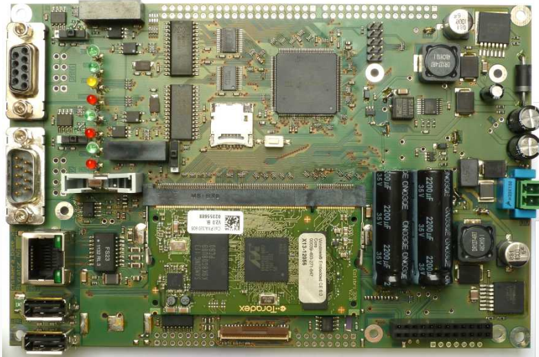
Lu750: Eine konkrete Ausprägung des chimæra EmbSys

In engster Zusammenarbeit mit der Lüscher AG Maschinenbau, dem Schweizer Technologie-Leader in Sachen Computer-to-Plate Belichter, hat die Biviator AG eine neue CoDeSys V3 Steuerung entwickelt. Wie der Name chimæra - das Mischwesen aus der Mythologie - schon andeutet, wurde das Anzeige- und Steuergerät genau auf die Anforderungen im Einsatz angepasst. Dank modularem Aufbau, einem breiten Schnittstellenangebot und dem Einsatz von FPGA-Technologie ist die chimæra auch für neue Herausforderungen schon bestens gerüstet.