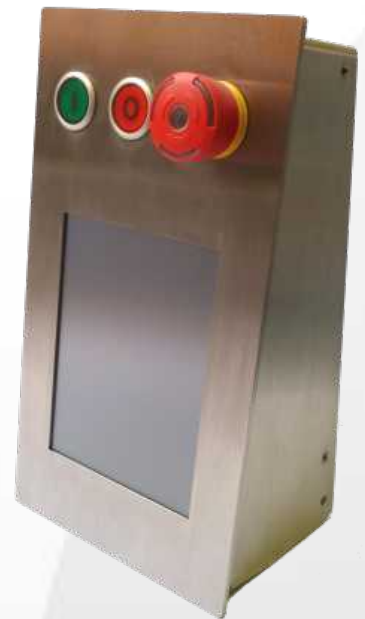
chimæra Lu750 im Gehäuse

Aus dieser Grundidee wurde schliesslich die chimæra Lu750 geboren, eine konkrete Ausprägung der anpassbaren chimæra EmbSys. Das System setzt sich zusammen aus einer 100Mbit Ethernetchnittstelle, Filesystem und zwei mal USB Host zur Anbindung an die Computerwelt. Das Tor in die Industrie bieten zwei CANopen Master Schnittstellen zur Aufteilung der Last auf zwei Kreise. Programmiert wird das System mit der modernen CoDeSys V3 Entwicklungsumgebung, welche neben objektorientierter Programmierung, auch gleich eine Tool interne Visualisierung und ein Versionsmanagement mitbringt. Zur Erweiterung stehen etliche weitere Schnittstellen, GPIOs und ein FPGA zur Verfügung, welches sogar Hardwareprogrammierung in VHDL zulässt.